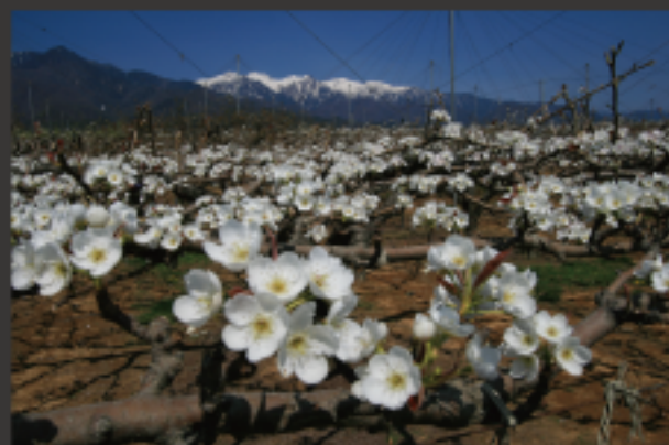
撮影地 南信州松川町