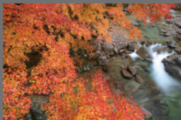
撮影地 南信州根羽村