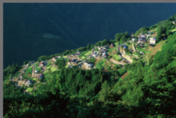
撮影地 南信州飯田市