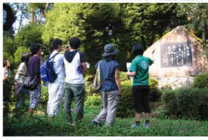
天龍峡ご案内人と遊歩道散策