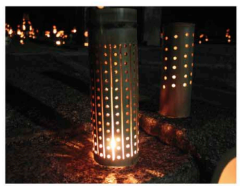
座光寺 除夜の竹宵より

特産品である竹をつかって、地元川路地区竹宵グループのみなさんの協力により、自分だけの「インテリアライト・ガーデンライト」の制作体験をしていただけます。竹の持つ奥深い魅力に、グ〜っと引きつけられてしまいます。