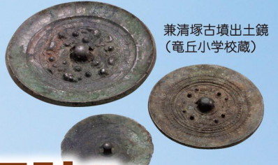
兼清塚古墳出土鏡 (竜丘小学校蔵)