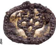
金銅製馬具 (座光寺地区内出土)

国史跡指定を記念して、出土遺物を一堂にそろえて展示しています。武器、鏡、金環や耳飾りなど装身具のほか、飯田の古墳を特徴づける馬に関する豊富な遺物について、特別に専門学芸員から説明があります!