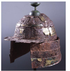
肩庇付冑 (長野県宝妙前大塚古墳出土)