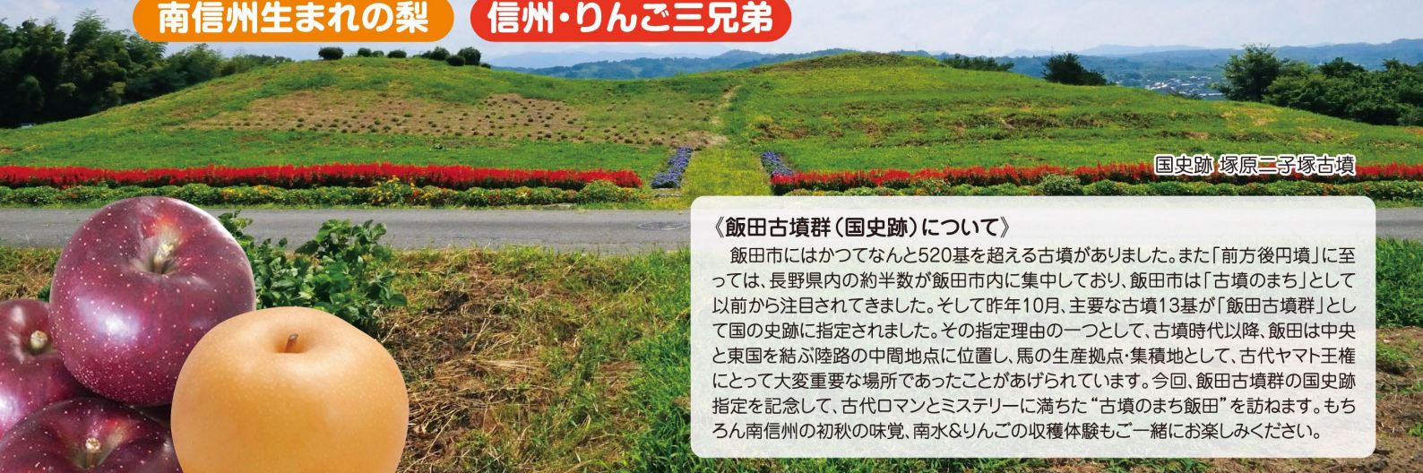
国史跡 塚原三子塚古墳