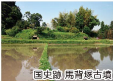
国史跡 馬背塚古墳

●塚原三子塚古墳(国史跡 前方後円墳) 塚原三子塚古墳は、鏡塚古墳、鏡塚古墳など大小16基の古墳から成る塚原古墳群の盟主とされる古墳です。発掘調査から二重の周溝が確認されています。周辺景観とともに良好な姿を残す古墳です。