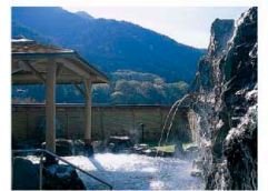
かぐらの湯 霧天風呂

遠山郷では断層が交差をしていて、断層の上には「気」が発生しているといわれています。42.5度のナトリウム・カルシウム塩化物泉は全国でも珍しい温泉。神事を大切にするこの地において、まさに神からの贈り物です。