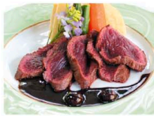
写真は料理イメージです

大鹿村「赤石荘」にて昼食。旬の大鹿産野菜と鹿肉の持つ旨味を最大限に引き出した「大鹿ならではの」ジビエ料理をご堪能頂けます。