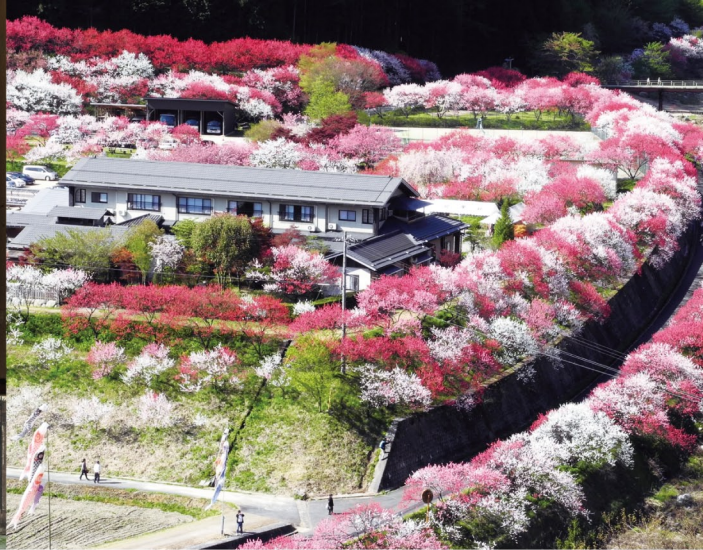
日本一の花桃の里 月川温泉郷