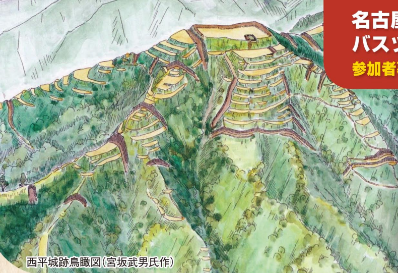
西平城跡鳥瞰図(宮坂武男氏作)