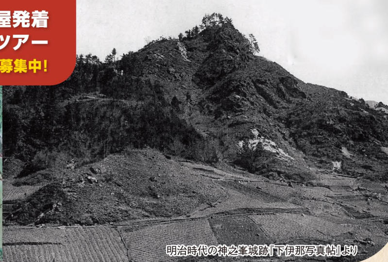
明治時代の神之峯城跡