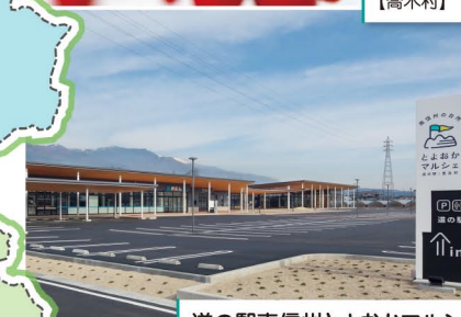
道の駅南信州とよおかマルシェ 【豊丘村】

2018年にオープンした「道の駅南信州とよおかマルシェ」には、生鮮食料品や生活用品を取り扱うスーパーマーケットも併設されています。先輩移住者が経営している飲食店、宿泊施設などもあります。特産の松茸や豊富な果物も自慢。