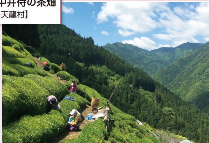
中井侍の茶畑 【天龍村】

早稲田人形座、新野の盆踊り、雪祭り、和合の念仏踊りなど、伝統芸能の宝庫。一般社団法人信州あなんトータルマーケティング(信州アトム)は農業振興、都市との交流促進を手掛けています。