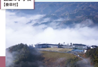
雲上の小学校 【泰阜村】

秘境駅ランキング上位に常時ランクインするJR飯田線・田本駅がある村。全国で唯一、小学校に併設された「学校美術館」の物語には感動を覚えます。豊かな環境を活かした自然教育など、子育て支援が充実しています。