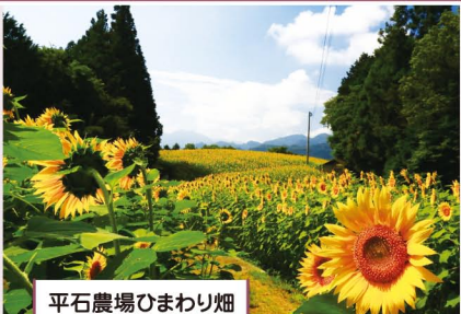
平石農場ひまわり畑 【阿南町】

リンゴや干し柿などの果樹園やそば畑とアルプスの山々とのコントラストが実に美しい村。飯田市に隣接し、充実した子育て支援施策が目される、小さいけれどコンパクトでほどよい田舎。道の駅ではそば打ち体験などが楽しめます。