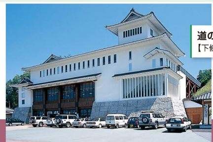
道の駅信濃路下條(そばの城) 【下條村】