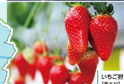
いちご狩り 【喬木村】

2027年開業のリニア長野県駅から車で5分の村。天竜川が形成した段丘で、山間地、農村、住宅地と暮らし方が変わります。いちご狩りが有名で多くの方が訪れます。スポーツ施設が整っており自分のペースで様々なスポーツが楽しめます。