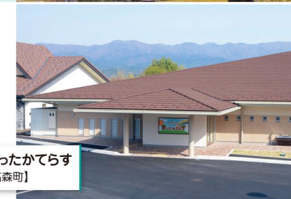
あったかてらす 【高森町】

地域ブランド「市田柿」発祥の地。女性が安心して妊娠、出産、子育てができ、産んだ後も安心して仕事ができる、子育てと働く女性の拠点施設「あったかてらす」が2018年にオープンしました。