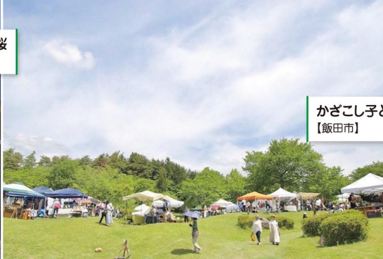
かごこし子どもの森公園 【飯田市】