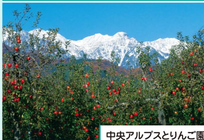
中央アルプスとりんご園 【松川町】