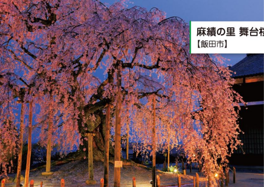
麻績の里 舞台桜 【飯田市】