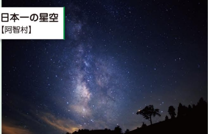
日本一の星空 【阿智村】

環境省認定の「日本一の星空」と1万本の花桃が彩る「日本一の花桃の里」。そして南信州随一の温泉郷「昼神温泉」がある自然豊かな観光の村です。又、村内の清内路地区は長野県の移住モデル地区に認定されています。