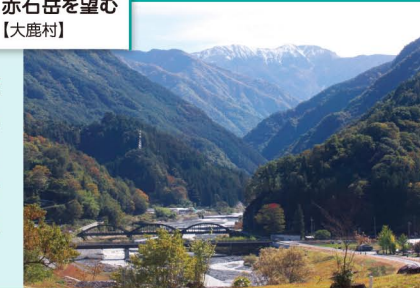
赤石岳を望む 【大鹿村】

リンゴ、梨、サクランボ、桃など美味しい果物の宝庫。町営の日帰り温泉&宿泊施設、森林セラピー基地もある。春のつつじ祭り、夏の祇園祭、秋のそば祭りなどお楽しみイベントも盛りだくさん。