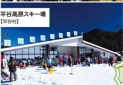
平谷高原スキー場 【平谷村】

道の駅信州平谷には、大きな露天風呂が売りの日帰り温泉が併設され、夏には施設の周りに、村のシンボルのひまわりが一面に咲き誇ります。スキー場、ゴルフ場、管理釣り場、パラグライダーなどアウトドアレジャーも盛ん。