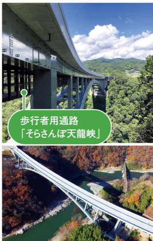
歩行者用通路 「そらさんぽ天龍峡」

天龍峡の魅力を紹介する新たなガイド施設「よって館」を見学した後、静かな森の小径を通り、「そらさんぽ天龍峡」から天龍峡の眺望をお楽しみいただけます。