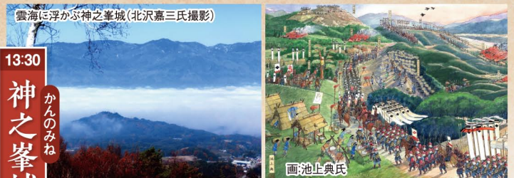
雲海に浮かぶ神之峯城