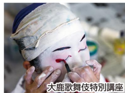
大鹿歌舞伎特別講座