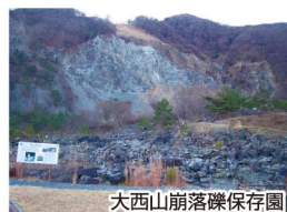
大西山崩落礫保存園