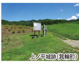
上ノ平城跡(箕輪町)