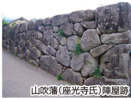
山吹藩(座光寺氏)陣屋跡