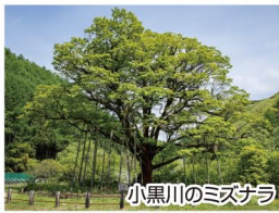
小黒川のミズナラ