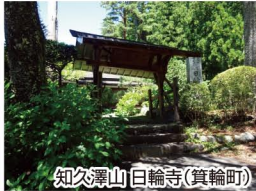
知久澤山日輪寺(箕輪町)