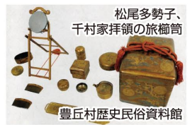
豊丘村歴史民俗資料館