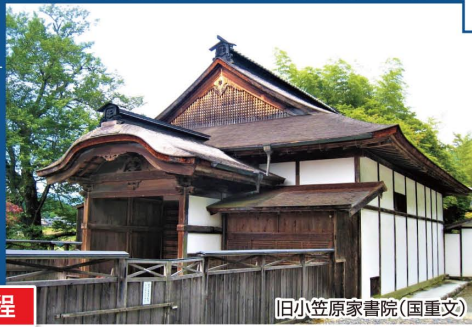
旧小笠原家書院(国重文)