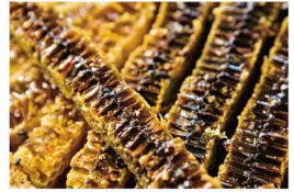
ミツバチの巣(試食)