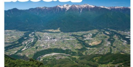
陣馬形山より中央アルプスを望む