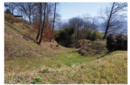
鈴岡城跡(鈴岡小笠原氏居城)