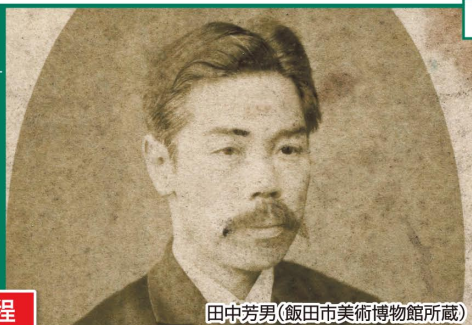
田中芳男(飯田市美術博物館所蔵)