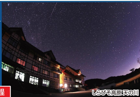
しらびそ高原「天の川」