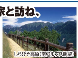
しらびそ高原(南アルプス眺望)