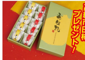
高級市田柿 プレゼント!