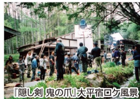
『隠し剣 鬼の爪』大平宿回付風景