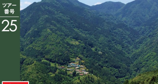
坂部集落遠望(中井侍から)