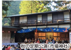
秋の定期公演(市場神社)