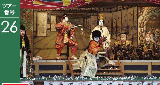
大鹿歌舞伎「六千両後日之文章重忠館の段」