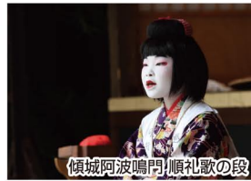
傾城阿波鳴門 順礼歌の段